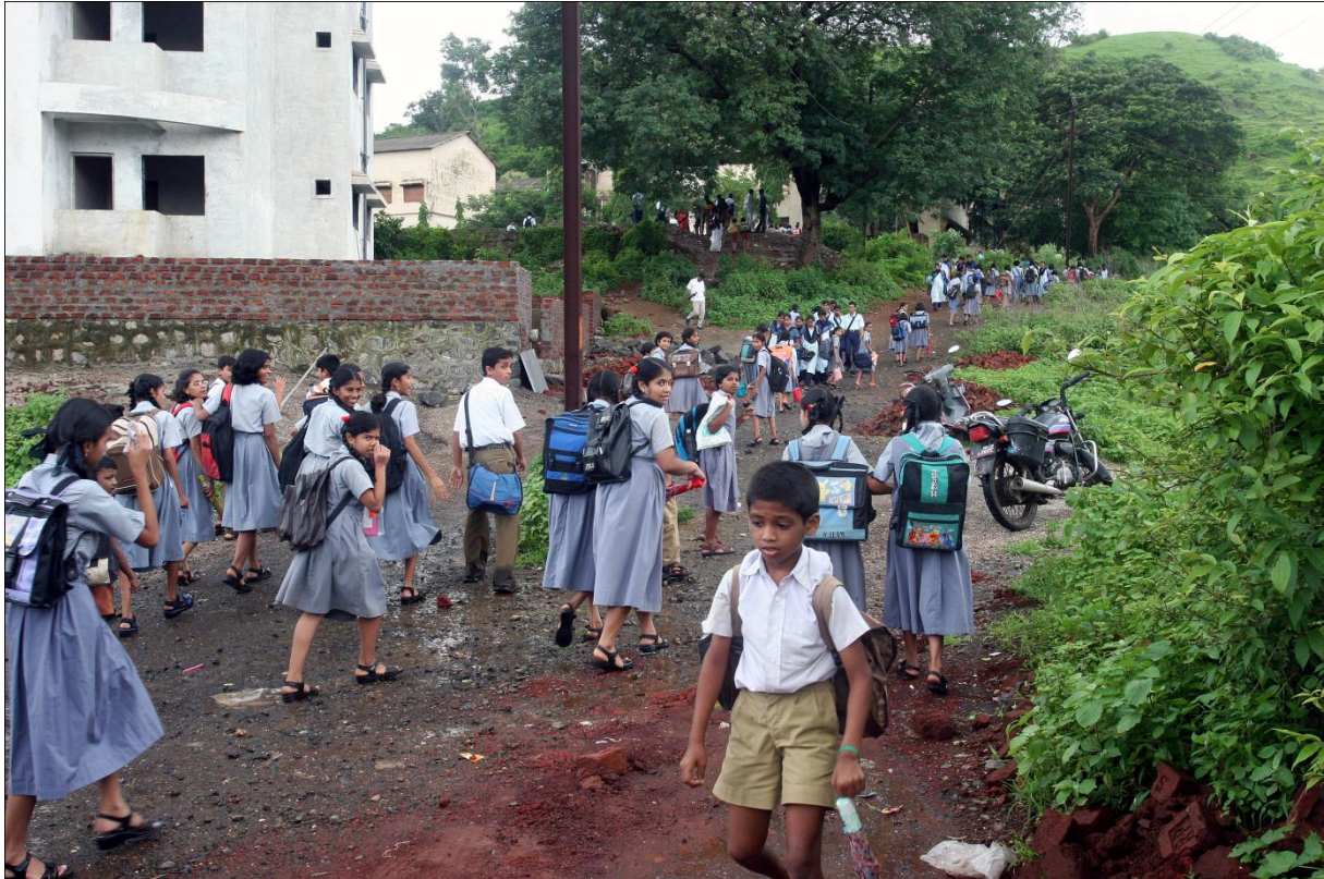
Glade barn på vei til dagens skoleundervisning. Utdanning i IBHN sitt fjernadopsjonsprogram er en av tre prioriterte tematiske områder.